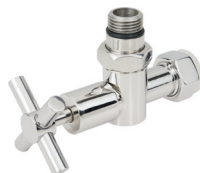
Вентиль запорный (крестовой) G 1/2" НР x 3/4" НГ арт. 01002-1234