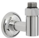
Набор комплектующих для ПС G 1/2" НР x G 1/2" НР арт. 03003-121