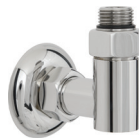
Набор комплектующих для ПС G 1/2" НР x G 3/4" НГ арт. 03002-1234